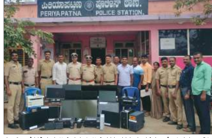
ಸರ್ಕಾರಿ ಶಾಲೆಗಳಲ್ಲಿ ಕಂಪ್ಯೂಟರ್ ಮತ್ತು ಪ್ರಿಂಟರ್ ಗಳನ್ನು ಕಳವು ಮಾಡುತ್ತಿದ್ದ ಆರೋಪಿಯನ್ನು ಬಂಧಿಸಿದ ಪಿರಿಯಾಪಟ್ಟಣ ಪೊಲೀಸರು ಆರೋಪಿಯಿಂದ ಕಳವು ವಸ್ತುಗಳನ್ನು ವಶಪಡಿಸಿಕೊಂಡಿರುವುದು.