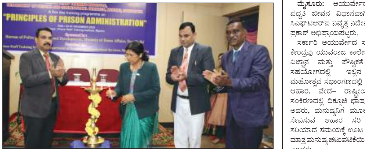
ಪ್ರಿನ್ಸಿಪಲ್ ಆಫ್ ಪ್ರಿನ್ಸಿಪಲ್ಸ್ ಆಫ್ ಇನ್‌ಸ್ಟಿಟ್ಯೂಷನ್ ಕಾರ್ಯಾಗಾರವನ್ನು ಪ್ರಧಾನ ಜಿಲ್ಲಾ ಮತ್ತು ಸತ್ರ ನ್ಯಾಯಾಧೀಶರಾದ ಉಪಾರಾಣಿ ಉದ್ಘಾಟಿಸಿದರು.

ಮೈಸೂರು: ಕಾರಾಗೃಹದ ಸಿಬ್ಬಂದಿ ಆರೋಪಿಗಳು, ಅಪರಾಧಿಗಳ ಸುಧಾರಣೆಗೆ ಸದಾ ಶ್ರಮಿಸಬೇಕು. ತಮ್ಮ ಕರ್ತವ್ಯದಲ್ಲಿ ಸೂಕ್ತ ಇಚ್ಛುಕೊಳ್ಳಬೇಕು ಎಂದು ಪ್ರಧಾನ ಜಿಲ್ಲಾ ಮತ್ತು ಸತ್ರ ನ್ಯಾಯಾಧೀಶರಾದ ಉಪಾರಾಣಿ ತಿಳಿಸಿದರು. ಕೇಂದ್ರ ಕಾರಾಗೃಹದ ಕಾರಾಗೃಹ ಸಿಬ್ಬಂದಿ ತರಬೇತಿ ಸಂಸ್ಥೆಯಲ್ಲಿ, ಕಾರಾಗೃಹ ಮತ್ತು ಸುಧಾರಣಾ ಸೇವಾ ಇಲಾಖೆಯ ಸಿಬ್ಬಂದಿಗಳಿಗೆ ದೆಹಲಿಯ ಬಿ.ಪಿ.ಆರ್.ಡಿ ಪ್ರಾಯೋಜಿತದಲ್ಲಿ ಐದು ದಿನಗಳ ಕಾಲ ನಡೆಯುವ "PRINCIPLES OF PRISON ADMINISTRATION" ಕಾರ್ಯಾಗಾರವನ್ನು ಉದ್ಘಾಟಿಸಿ ಅವರು ಮಾತನಾಡಿದರು.