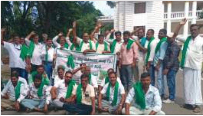
ಭತ್ತ ಖರೀದಿ ಕೇಂದ್ರ ಆರಂಭಿಸಲು ಒತ್ತಾಯಿಸಿ ಕರ್ನಾಟಕ ರಾಜ್ಯ ಕಬ್ಬು ಬೆಳೆಗಾರ ಸಂಘದ ವತಿಯಿಂದ ಜಿಲ್ಲಾಧಿಕಾರಿ ಕಚೇರಿ ಬಳಿ ರೈತರು ಪ್ರತಿಭಟನೆ ನಡೆಸಿದರು.

ಮೈಸೂರು: ಭತ್ತ ಖರೀದಿ ಕೇಂದ್ರ ಆರಂಭಿಸಲು ಒತ್ತಾಯಿಸಿ ಕರ್ನಾಟಕ ರಾಜ್ಯ ಕಬ್ಬು ಬೆಳೆಗಾರ ಸಂಘದ ವತಿಯಿಂದ ಜಿಲ್ಲಾಧಿಕಾರಿ ಕಚೇರಿ ಬಳಿ ಪ್ರತಿಭಟನೆ ನಡೆಸಲಾಯಿತು. ಕೇಂದ್ರ ಸರ್ಕಾರ ನಿಗದಿ ಮಾಡಿರುವ ಎಫ್‌ಆರ್‌ಒ 2,369 ರೂ. ಜತೆಗೆ ರಾಜ್ಯ ಸರ್ಕಾರ ಪ್ರತಿ ಕ್ವಿಂಟಾಲ್ ಭತ್ತಕ್ಕೆ 500 ರೂ. ಹೆಚ್ಚುವರಿ ದರ ನಿಗದಿ ಗ್ರಾಮ ಪಂಚಾಯತ್ ಮಟ್ಟದಲ್ಲಿ ನೋಂದಣಿ ಪ್ರಕ್ರಿಯೆ ಆರಂಭಿಸಬೇಕು. ಪಡಿತರ ವಿತರಣೆಗೆ ಬೇರೆ ರಾಜ್ಯದ ಅಕ್ಕಿ ಬಳಸುತ್ತಿದ್ದು, ಅದನ್ನು ನಿಲ್ಲಿಸಿ ರೈತರು ಬೆಳೆದ ಎಲ್ಲಾ ಭತ್ತವನ್ನೂ ಖರೀದಿ ಕೇಂದ್ರದ ಮೂಲಕ ಖರೀದಿಸಲು ಕೃಷಿ ಮತ್ತು ಕಂದಾಯ ಇಲಾಖೆಯ ಜಂಟಿ ಸಮಿತಿ ರಚಿಸಬೇಕು. ರೈತರ ಭತ್ತ ಖರೀದಿ ಮಾಡಲು ಬೇಡಿಕೆ ಇರಬಾರದು. ಕಟಾವು ಪ್ರಾರಂಭವಾದ ತಕ್ಷಣ ಭತ್ತ ಖರೀದಿಗೆ ಕ್ರಮ ಕೈಗೊಳ್ಳಬೇಕು. ಅಧಿಕ ಷರತ್ತುಗಳನ್ನು ವಿಧಿಸಿ ರೈತರು ಖರೀದಿ ಕೇಂದ್ರದಲ್ಲಿ ಭತ್ತ ಮಾರಾಟ ಮಾಡದ ರೀತಿ ನಿಯಮ ಸೃಷ್ಟಿಸಬಾರದು ಎಂದು ಆಗ್ರಹಿಸಿದರು.