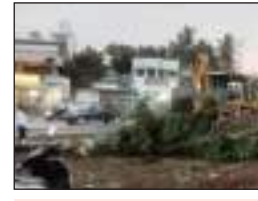
ಕನಕಪುರದ ಅಂಚೆ ಕಚೇರಿ ಬಳಿ

ಕನಕಪುರ: ನಗರದ ಚಿನ್ನಬಸವಪ್ಪ ಸಮೀಪ ವಿವಾದಕ್ಕೆ ಡಾಗಿದ್ದ ಚಿ.ಡಿ.ಎಸ್ ಪಕ್ಷದ ಕಚೇರಿಯನ್ನು ನ್ಯಾಯಾಲಯದ ಆದೇಶದ ಮೇರೆಗೆ ಕಾಂಗ್ರೆಸ್ ಪಕ್ಷದಿಂದ ತೆರವುಗೊಳಿಸಲಾಯಿತು.