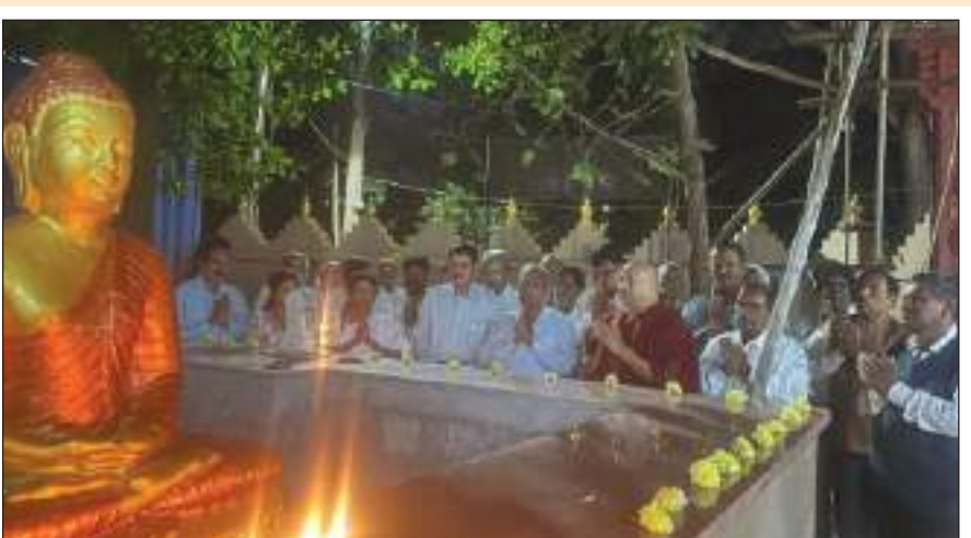
ವಿಷಯ ಕುರಿತ ಸಂವಾದ ಕಾರ್ಯಕ್ರಮದಲ್ಲಿ ಅವರು ಮಾತನಾಡಿದರು. ಪ್ರತಿಯೊಬ್ಬ ವ್ಯಕ್ತಿಯ ಸಾಮಾಜಿಕವಾಗಿ, ಭಾವನಾತ್ಮಕವಾಗಿ, ಭೌತಿಕವಾಗಿ, ವಾಸನಿಕ ಮತ್ತು ಆಧ್ಯಾತ್ಮಿಕ ಎಂಬ ಪಂಚ ಅಂಶಗಳ ಮೂಲಕ